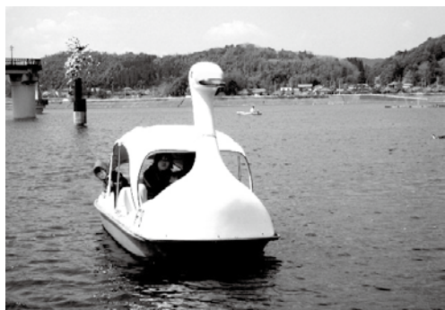
釣りボート・遊ボート・釣り具