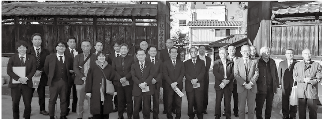
合同視察研修の参加者（株式会社飯沼本家）

千葉県中小企業団体事務局責任者協会・千葉県中小企業組合士会視察研修及び忘年会 開催