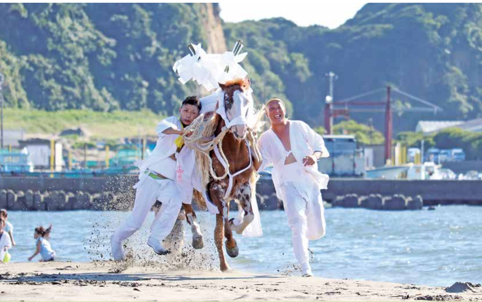
表紙写真／吾妻神社の馬だし祭り（毎年9月開催）

千葉県中小企業団体事務局責任者協会・千葉県中小企業 組合士会合同視察・研修・忘年会の開催について 他