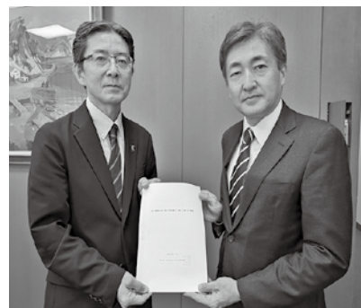
佐々木県市長会事務局長 ・県町村会事務局長（左） に要望