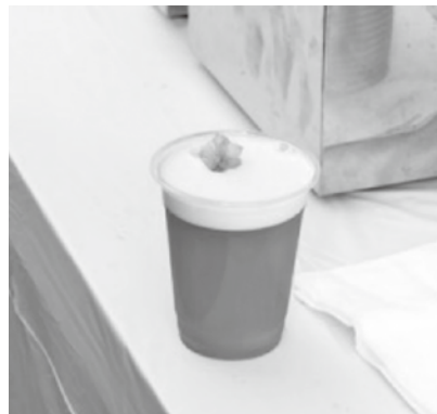
↑前橋めぶく。ビール