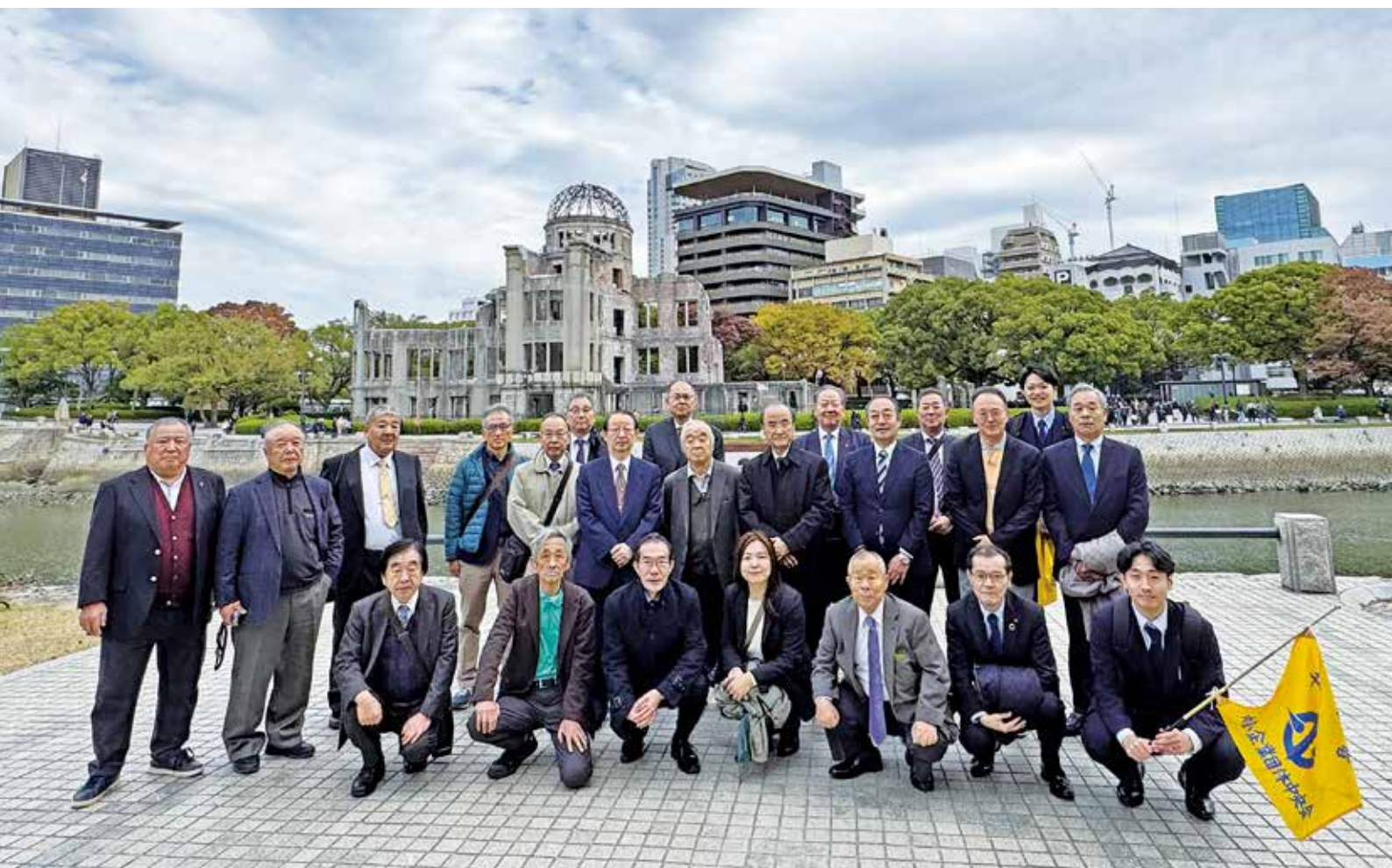
表紙写真／（第77回中小企業団体全国大会広島大会の参加者記念写真）