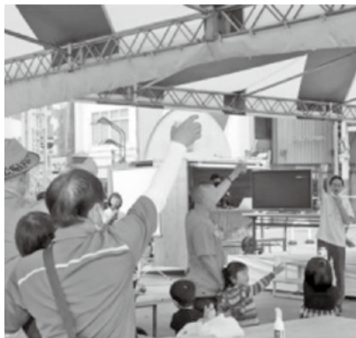
↑お披露目イベントで完成を祝う参加者

住所：〒371-0022 群馬県前橋市千代田町 二丁目8番9号 設立：平成7年4月 URL：http://maebashi.info/ 主な業種：小売業、サービス業、 飲食店 組合員数：317人 出資金：8,280千円