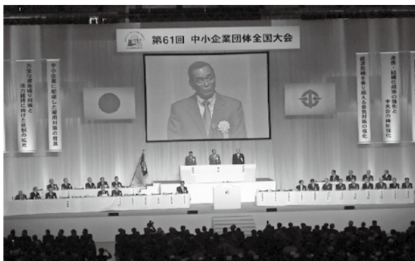
第61回中小企業団体全国大会(千葉県大会) (幕張メッセ・イベントホール)