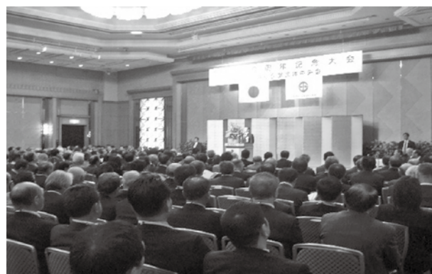
創立60周年記念大会 表彰式 (ホテルニューオータニ幕張)

1月には創立60周年記念大会及び中小企業団体千葉県新春交流会を開催。「連携・団結～紡ぎつなげる新たな連携強化～」のスローガンの下、県下の会員組合及び構成員企業等約800名の方々が参加した。