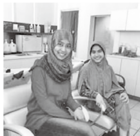
イスラム女性への店舗対応

に対応している。今後は、千葉市や大学との連携を深め、顧客獲得と共に店舗拡大に努めていきたいとしている。さらに、和服をはじめ日本の美容文化の情報発信等を行い、インバウンド集客につなげ、日本美容文化の体験をできるように環境を整えていく。