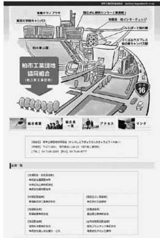
▲組合のホームページ

空撮はラジコンヘリやドローンを飛ばして…と決ま りかけていたのですが、研 究会開催期間中に「ドロー ンの落下」が社会問題化し てしまったのと、屋根の塗 装が劣化しているのが古い