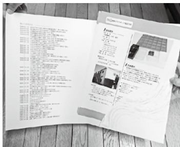
▲これまでの組合パンフ

前回の作成は平成13年頃で、その後の会員企業の入れ替わりにはチラシを差し替えて対応し、事業承継などによる代表者の氏名変