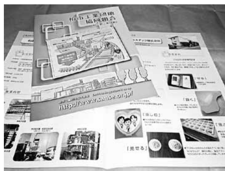
▲完成した700部の新パンフレット

デジタル印刷機はオンデマンド 印刷機とも呼ばれ、ざっくりした 表現をすると、高級な業務用プ リントであり、最近の機種では 従来のオフセット印刷機とほぼ仕 上がりには遜色なく、用紙の質も問 わないこと等を研究会ではサンプ ルで確認しました。