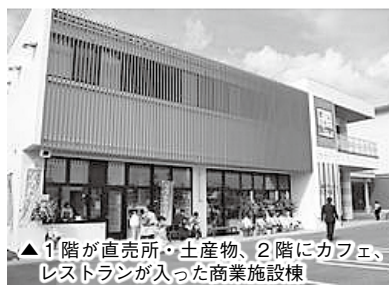
▲1階が直売所・土産物、2階にカフェ、レストランが入った商業施設棟

新店舗では、当社のサービスに触れたお客様の心を満たすこと、そして、多くの地元の人びとに支持される店舗づくり(脱・観光向け食事処)を大切にしたいと考えています。皆さま、お近くにお越しの際は、ぜひ「渚の駅」たてやまにいらしてみて下さい。