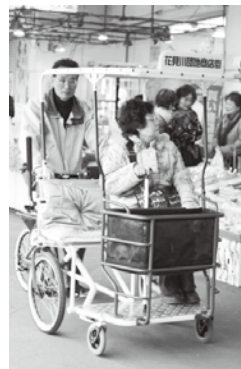
▲買い物客送迎用三輪自転車