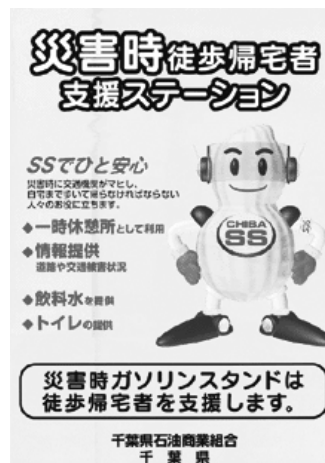
「災害時帰宅支援ステーションステッカー」