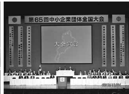
第65回中小企業団体全国大会