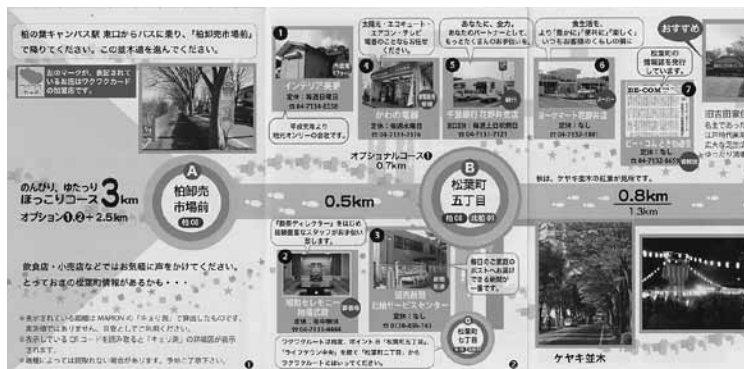
「ほっこり・ゆったりルート」はケヤキ並木や桜が楽しめるコース

3千部印刷したウォーキングマップは、会員店舗で配布していくほか、イベントなどでも配布され、人々の手に渡っていく予定だ。さらに、今回盛り込むことができなかった内容についても、別途、各店舗でチラシに反映したり、商店街HP等での情報提供に活用されたりなど、さまざまに活かされていくことだろう。（片岡由美）