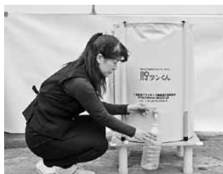
▲（貯タンくん）使用時