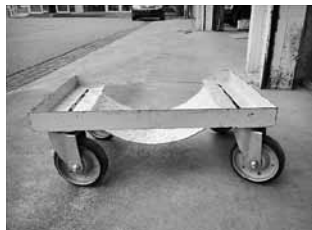
▲ 当社自作トレッカー (事故車搬送時、積載車で搬送する際に非常に便利)

での引き上げ作業時にかかる牽引力に耐えるよう、トレーと補助輪との接続部の溶接を強化しました。併せて、トレッカーの車輪を可変方向タイプとすることで、方向転換をできるようにしました。 ③チューブ式でない車輪の採用等 補助輪のエア抜けに対応するため、チューブ式でない車輪(ゴム樹脂の塊)を採用しました。また、補助輪の半径を従来品の2倍以上とすることで、地面に段差のある場所でも移動しやすくしました。補助輪の半径を大きくすることで、より大きな段差に乗り上げられるようになります。 不動車搬送現場で実用できるようにするため、試行錯誤を繰り返して、今般、当社の独自トレッカーを現場に導入できる目処が立ちました。約1年間に及ぶ現場試用で一度も不具合を生じていませんので、安全性も実証できていると考えています。独自トレッカーの現場導入により、当社は不動車修理におけるこれまでのチャンスを解消することができ