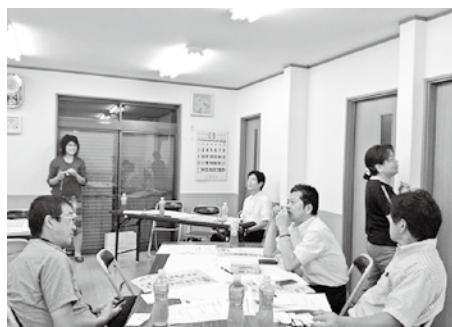
（第1回勉強会・ワークショップの様子）

そして、ワークショップ形式でグループ毎に「魅力的な商店街マップとは」を話し合い、模造紙にまとめて発表した。全体の方向性は、以下のように集約した。