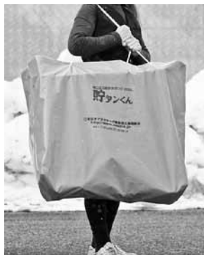
▲（貯タンくん）持ち運び時

さらには、組合青年部という次世代の組合員が主体となっていくの目標に向かって協力し、成功を収めたことは、自信とモチベーションの向上に繋がっただけでなく、組合への帰属意識も高め、将来において組合をリードする人材を育てる結果となったことも大きな成果となっている。