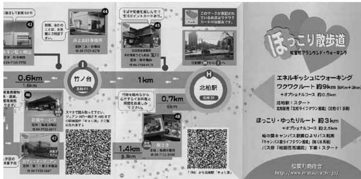
「ワクワクルート」は北柏駅周辺を楽しんでスタートするコース