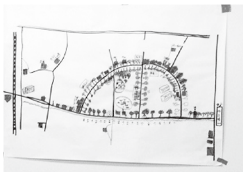
（地域情報を書き込んだ手描きマップ）

そして、商店街が位置する通り沿いには春には桜並木を楽しめるイベントがあること、ケヤキ並木はお散歩に最適であることなど、長年住んでいるからこそ提供できる地域情報や商店の位置を模造紙に描いていった。