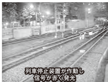
列車停止装置が作動し 信号が赤く発光

そこで当社は、列車停止装置作動時の緊急連絡の即時伝達と、故障の場合「装置のどの個所でのような障害が発生しているのか」を早く、詳しく当社に伝える機能を有する遠隔監視システムを構築し、工事現場に導入することを計画しました。