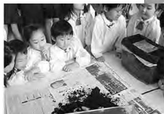
カブトムシの幼虫を幼稚園に配布