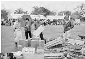
もくもくフェスタの様子

額に比べると大幅な成果を得ている。落札件数も指定管理者は6案件中3件受注、その他の指名競争入札でも3件中1件を落札しており、高い成果をあげている。組合では若手経営者の意見交換が活発になり、組合活動が活性化している。「公園及び緑地の管理運営」の外にも「袖ヶ浦市総合運動場・今井野球場の管理運営」をジョイントベンチャー方式で指定管理者を受注するなど、その他の共同受注も成功している。組合員は指定管理者の受託業務により安定的な仕事を得ることができ、資金的にも安定した経営ができるようになってきている。また、理事を中心に組合員の交流が活発になったことにより、他社の状況が判るので経営者の意欲が向上し、お互いに切磋琢磨して技能向上を図ろうとする気運が高まっている。