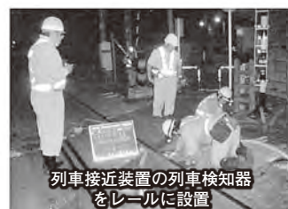
列車接近装置の列車検知器をレールに設置

多いのですが、差別化をと考えた結果、中央会様から助言があり申請に至りました。熱心なアドバイザーを頂き申請もスムーズに出来ました。ありがとうございました。ありがとうございます。これをきっかけに将来を見据えた経営の重要性をあらためて認識しました。